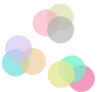
شکل ۳- وجود ثبات درونی و تک‌بعدی بودن مقیاس