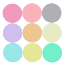
شکل ۲- عدم وجود ثبات درونی و تک‌بعدی بودن مقیاس

در شکل شماره ۳، نشان داده شده است که همه‌ی آیتم‌ها حداقل با سایر آیتم‌ها واریانس مشترک دارند. این نشان دهنده‌ی ثبات درونی بالا و تک‌بعدی بودن مقیاس است. اما در شکل شماره ۴، هر آیتم فقط با برخی از آیتم‌ها واریانس مشترک دارند. این نشان دهنده‌ی ثبات درونی بالا است، اما مقیاس اصلاً تک‌بعدی نیست.